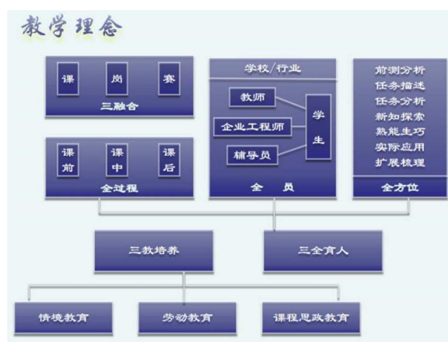
图1 《信息安全管理实务》教学理念。

以培养学生的职业能力与综合素质为导向，在“场景导入、技能发展、课程思政”的教学设计思路指导下[15]，实现课、岗、赛“三融合”，同时践行“全过程、全方位、全员”的“三全育人”模式[13]，并结合“情境教育、劳动教育、课程思政教育”于一体的“三教培养”[11]，在理实一体教学、反复强化训练中实现“三融、三全、三教”的教学理念[6]，如图1所示。