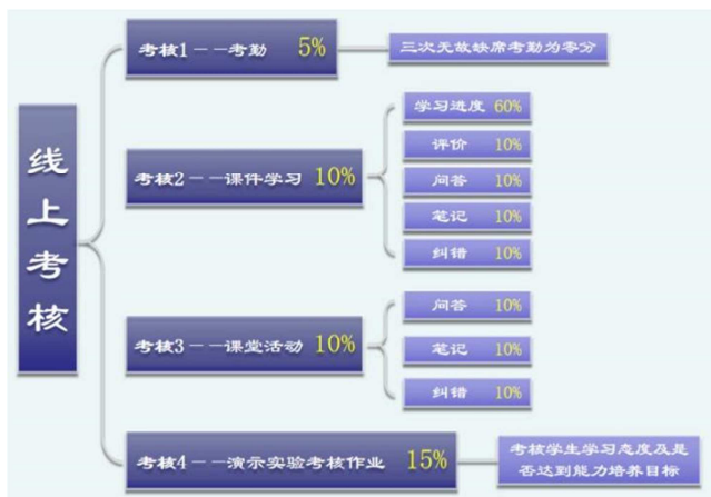
图5 线上考核评分方式。