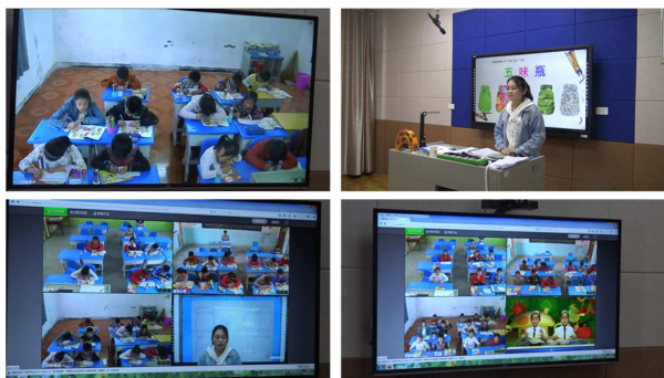
图2 中心校区同步互动专递课堂教师上课、显示屏。

还有一些其他类型的课堂活动比如音乐剧、击鼓传花等，具有创新性，和片段中的舞蹈教学一样在课堂中能够改变学生传统的以静为主的单调枯燥的学习方式，可发动全体学生主动参与、主动思考，将课堂的主体更最大限度地还给学生，帮助学生更充分的感受知识的魅力。