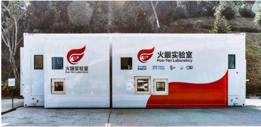
图5 箱式集装箱实物示意图。

在本次新冠肺炎疫情中，核酸检测实验室和隔离病房作为关键性的医疗资源，直接影响了各国应对疫情的管控能力。在检测实验室创新方面，德国、美国、法国等国家均推出了集装箱式或汽车货车改造的核酸检测实验室。意大利和新加坡也采用模块化的集装箱作为新冠隔离病房，中国推出了移动式核酸检测实验室、装配式P2+实验室、P2+移动方舱实验室、中国CDC传染病所移动实验室以及集成式核酸检测实验室的创新设计方案。 箱式集装箱模式方案既充分考虑全球生物安全要求和行业规范，又具备迅速响应、迅速移动、迅速投用的特点，使实验室更具有科技感。但缺点也不能完全忽视，一是通量小，只适用于局部快速检测，二是不能上飞机，只能通过陆运或海运方式进行运输，对于远距离运输的需求地，并不能快速响应需求。其箱式集装箱实物示意图见图5所示。