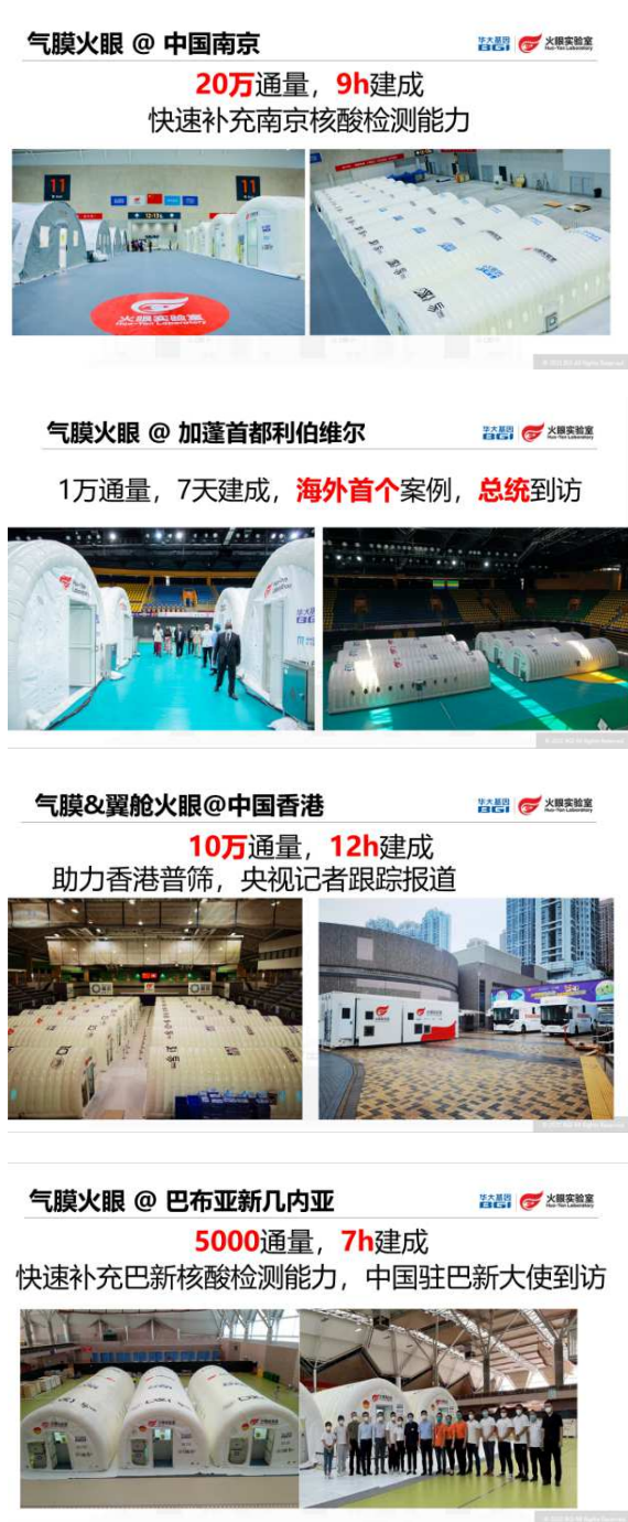
图6 部分火眼气膜结构案例展现。