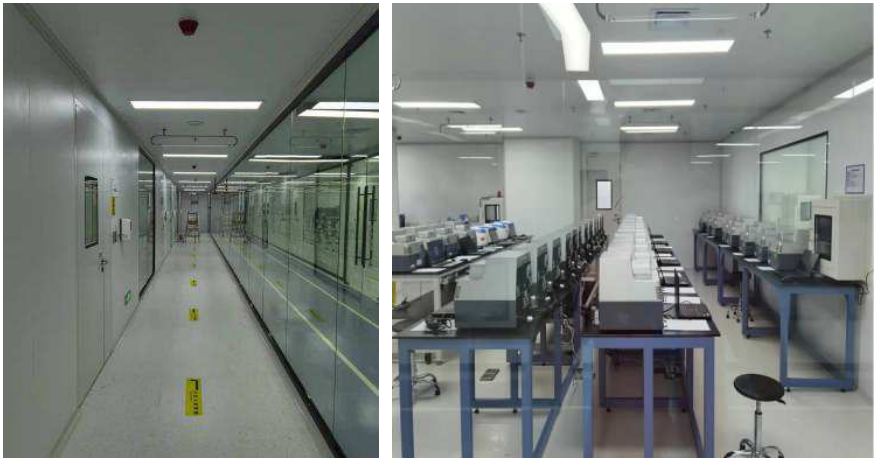
图2 传统实验室现场工作环境示意图。

传统实验室是新冠病毒核酸检测实验室的理想型模式，传统实验室主要是指已有实验室，从属于在用的医院；或者重新建造出一个医院，利用医院里面的实验室，如雷神山和火神山等较为快速建造的现代固定式建筑结构[16, 17]。但因为存在建设费用高，建设周期长两大局限性，在实际应急检测应用中成为主要限制因素，其现场实验工作环境如图2所示，常规建造全过程需要的建造时间分析如表1所示。通常情况下需要41周-78周，时间上难于满足要求。