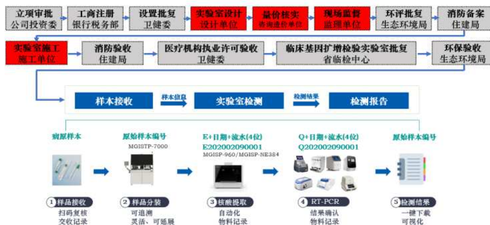
图1 新冠病毒核酸检测实验室整体流程图。

传统实验室的局限大, 新冠病毒肺炎疫情核酸检测实验室主要涉及实验室建设、样本接收、实验室检测和检测报告四个环节, 其中实验室建设环节涉及立项审批、工商注册、设置批复、实验室设计、量价核实、现场监督、环评批复、消防备案、住建局、医疗机构执业许可验收、临床基因扩增检验实验室批复、环保验收等13个环节, 要完成一个传统实验室的建设, 需要建设费用高, 动辄上千万的成本, 而且建设周期长, 甚至长达数月的时间需求, 新冠病毒核酸检测实验室整体流程图如图1所示。