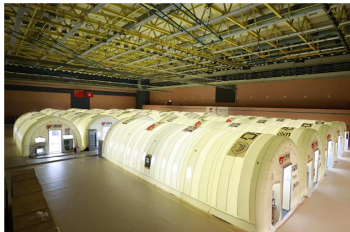
图4 充气膜结构病毒检测实验室实物图。

新型模块化气膜结构方案具有快速搭建的特性。火眼实验室(气膜版)通过充气膜结构和预制化建造系统结合，确保整个系统密闭，气膜被内部气压顶起，大大简化建筑支承的结构，搭建单个气膜舱只需要20分钟。核酸检测结