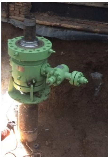
图4 更换后的套管头。