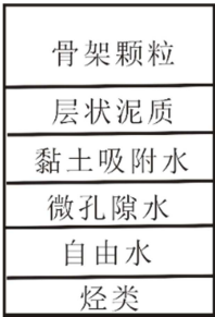
图1 砂岩导电体积模型。

在研究岩石导电网络时，前人早就通过建立导电体积模型的方式对岩石导电机理进行了简化 [17-18]，包括后来的毛管导电模型 [19-20]，并使用简化模型对岩石电阻率响应方程进行了推导。认为岩石组分可分为骨架、导电矿物、泥质、孔隙水和烃类。针对沉积砂岩，由于导电矿物比较少见，建立导电模型可不予考虑，这样所建立的岩石导电体积模型就包含岩石颗粒骨架、层状泥质、黏土吸附水、微孔隙水、自由水、烃类等，见图1。其中，岩石颗粒骨架和烃类是不参与导电的。